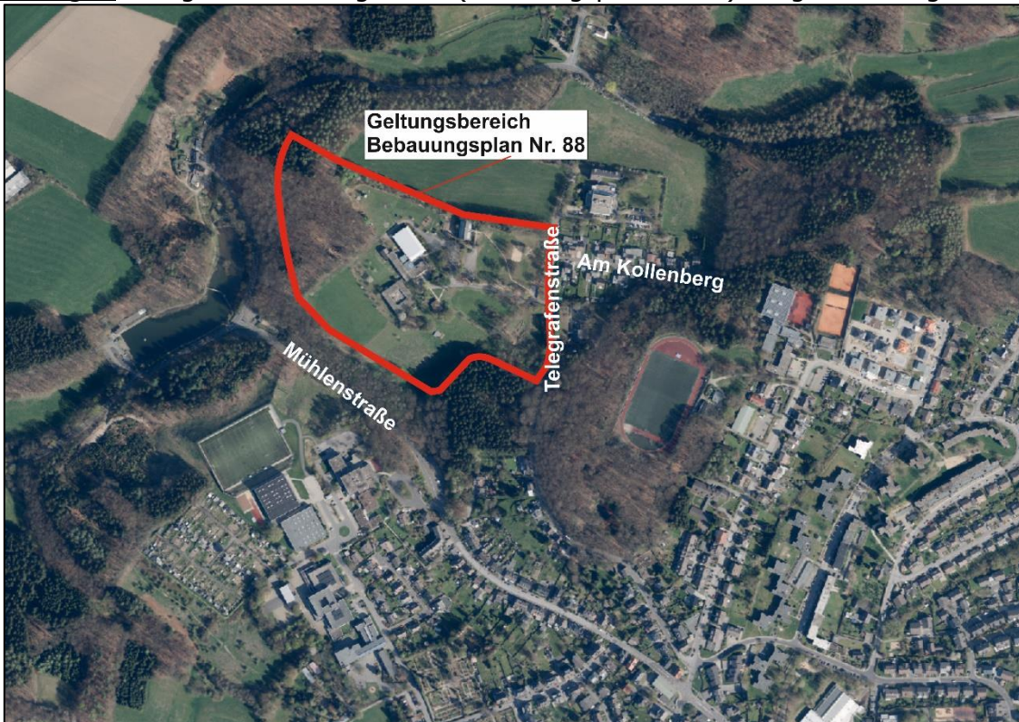
Abbildung 1: Evangelische Bildungsstätte (Bebauungsplan Nr. 88) - Lage im Stadtgebiet

Das Plangebiet umfasst die Flächen der evangelischen Bildungsstätte in der Telegrafensstraße (Geltungsbereich des Bebauungsplanes Nr. 88). Das Plangebiet mit seinen großzügigen Freiflächen liegt im städtebaulichen Zusammenhang mit Sportstätten und weiteren Bildungseinrichtungen ca. 1,2 km nördlich des Stadtzentrums, es umfasst in der Flur 30 die Flurstücke 56, 114 und 116.